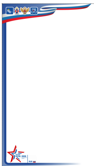
Рамка вертикальная (для видео)

https://dddgazeta.ru/upload/baners/ramka2026-gor.png