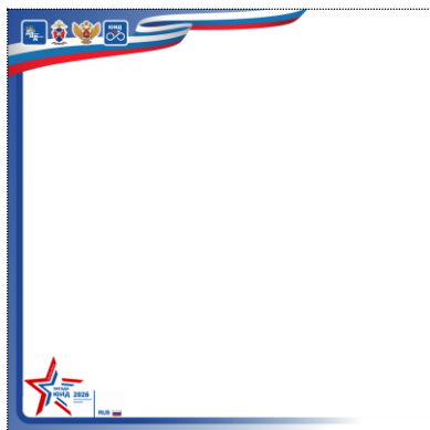
Рамка квадратная (фото)